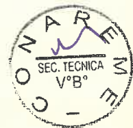
Dra. Norka Rocío Guillen Ponce Presidenta Consejo Nacional de Residencia Médica